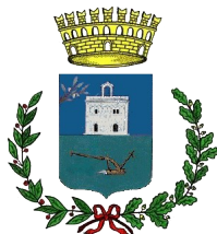
Comunu de Serdiana

Regioni Autònoma de Sardigna - Lei 482/99 e L.R. 22/2018