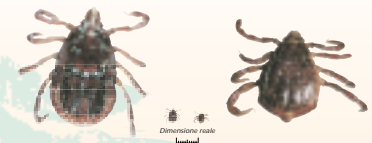
A sinistra: la femmina della zecca del cane ( R. sanguineus ). A destra: il maschio.